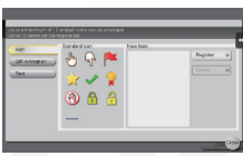
▲ 图标选择 / 注册屏幕