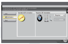
▲ GIF 动画剪辑 选择 / 注册屏幕