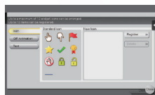
▲ 图标选择 / 注册屏幕