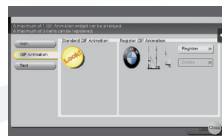
▲ GIF 动画剪辑 选择 / 注册屏幕